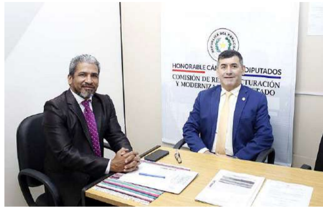
Integrantes de la Comisión de Reestructuración y Modernización del Estado, presidida por el legislador Diosnel Aguilera (PLRA-Ñeembucú), emiten dictamen favorable al proyecto "Que amplía el Presupuesto General de la Nación para el Ejercicio Fiscal 2026, aprobado por Ley Nº 7609/2025, a fin de dar cumplimiento a la Ley Nº 7.511/25 - Que modifica el artículo 60 de la Ley Nº 1562/2000 - Orgánica del Ministerio Público -, en beneficio de los asistentes fiscales del Ministerio Público".

La iniciativa legislativa contempla una ampliación presupuestaria de G. 17.050.067.048 para el Ministerio Público.