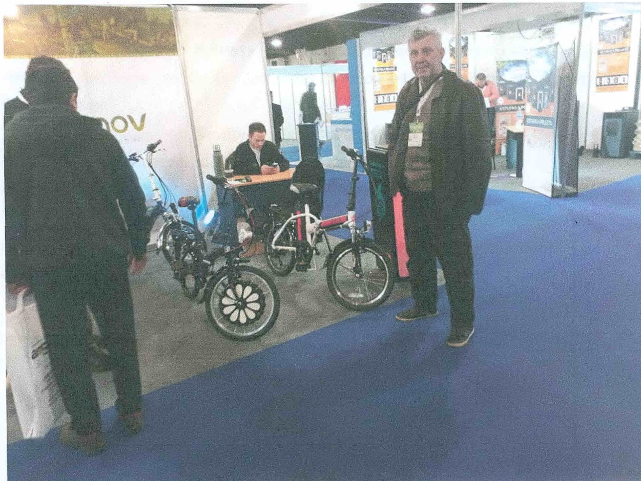
Bicicleta eléctrica en exposición en la II Expo Eficiencia Energética 2018 – Argentina.