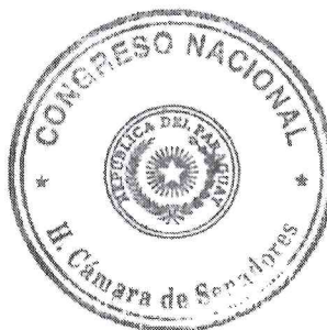
Fernando Lugo Méndez Vicepresidente 1º En ejercicio de la Presidencia H. Cámara de Senadores