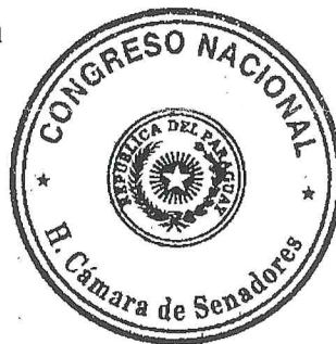
Fernando Lugo Méndez Vicepresidente 1º En ejercicio de la Presidencia H. Cámara de Senadores