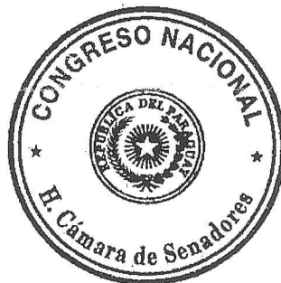
Fernando Lugo Méndez Vicepresidente 1° En ejercicio de la Presidencia H. Cámara de Senadores

A Su Excelencia Pedro Alliana Rodríguez , Presidente Honorable Cámara de Diputados Poder Legislativo