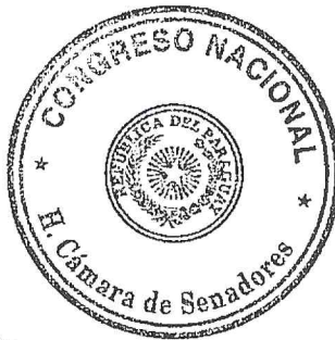
Fernando Lugo Méndez Vicepresidente 1° En ejercicio de la Presidencia H. Cámara de Senadores

A Su Excelencia Pedro Alliana Rodríguez , Presidente Honorable Cámara de Diputados Poder Legislativo