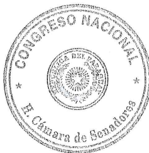
Fernando Lugo Méndez Vicepresidente 1º En ejercicio de la Presidencia H. Cámara de Senadores