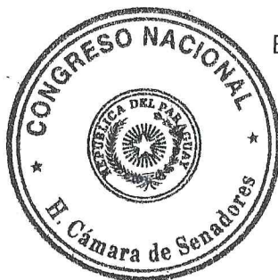
Fernando Lugo Méndez Vicepresidente 1° En ejercicio de la Presidencia H. Cámara de Senadores

A Su Excelencia Pedro Alliana Rodríguez , Presidente Honorable Cámara de Diputados Poder Legislativo