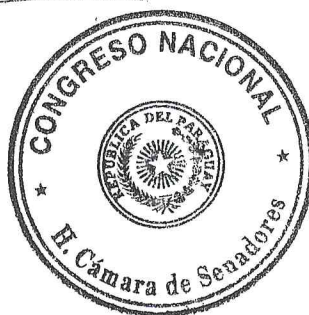
Fernando Lugo Méndez Vicepresidente 1º En ejercicio de la Presidencia H. Cámara de Senadores