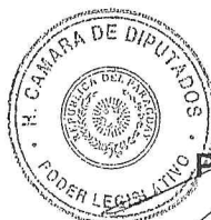
Pedro Alliana Rodríguez Presidente H. Cámara de Diputados