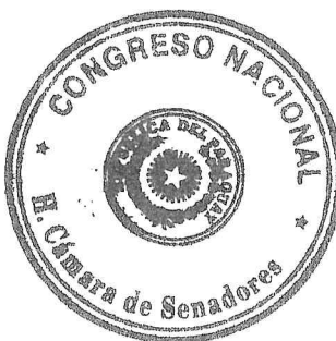
Martín Arévalo Vicepresidente 1º En ejercicio de la Presidencia H. Cámara de Senadores