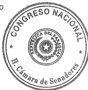
Martín Arévalo Vicepresidente 1° En ejercicio de la Presidencia H. Cámara de Senadores

A Su Excelencia Pedro Alliana Rodríguez , Presidente Honorable Cámara de Diputados Poder Legislativo