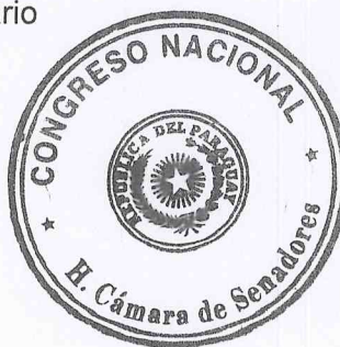
Martín Arévalo Vicepresidente 1° En ejercicio de la Presidencia H. Cámara de Senadores

A Su Excelencia Pedro Alliana Rodríguez , Presidente Honorable Cámara de Diputados Poder Legislativo