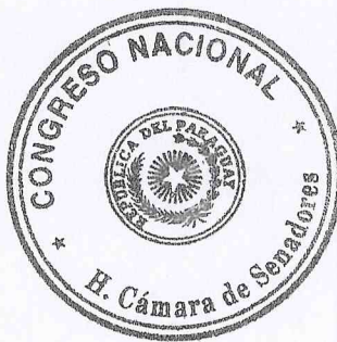
Martin Arévalo Vicepresidente 1° En ejercicio de la Presidencia H. Cámara de Senadores

A Su Excelencia Pedro Alliana Rodríguez , Presidente Honorable Cámara de Diputados Poder Legislativo