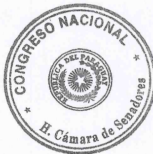
Martin Arévalo Vicepresidente 1° En ejercicio de la Presidencia H. Cámara de Senadores

A Su Excelencia Pedro Alliana Rodríguez , Presidente Honorable Cámara de Diputados Poder Legislativo